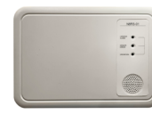
Détecteur de fuites R32 (CL09436)