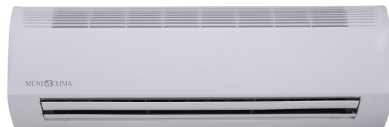
Modèle 71 a 80