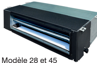
Modèle 28 et 45